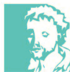
Association Saint Benoît Labre